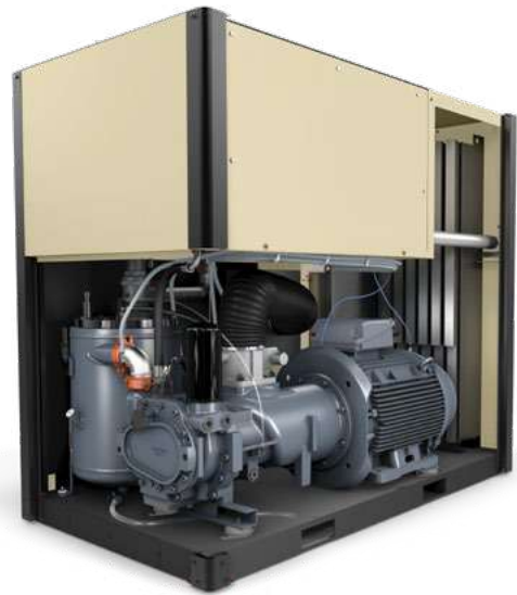
Next Generation R-Series-compressoren bieden superieure bedieningsfuncties, voordelen en onderdelen.

Met onze optionele aandrijving met variabel toerental kunt u nog meer besparen op energiekosten. Deze compressoren leveren een hoger rendement, zelfs bij deellast.