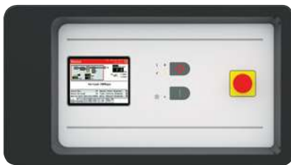
Blijf altijd verbonden met uw compressor met de Xe-Pro Series-controller.